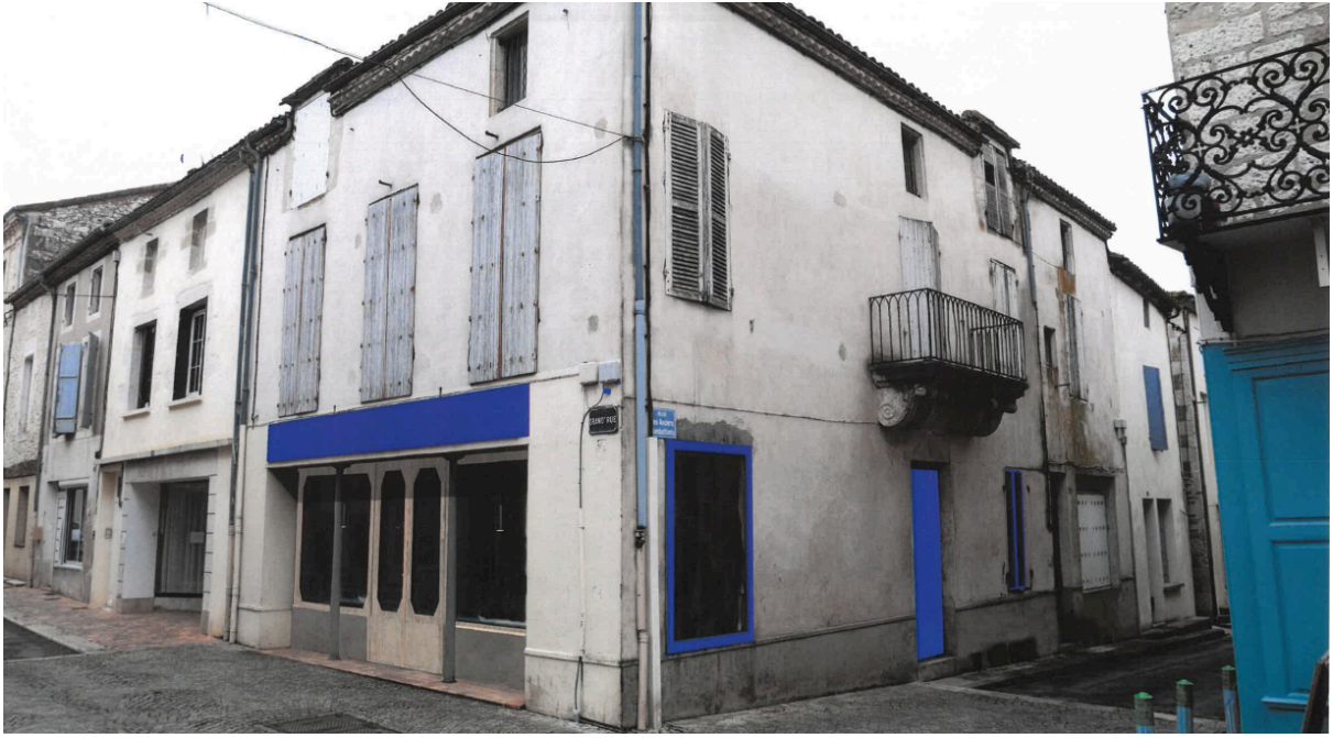
Vue du projet (pièce du permis de construire) - Seconde Ligne